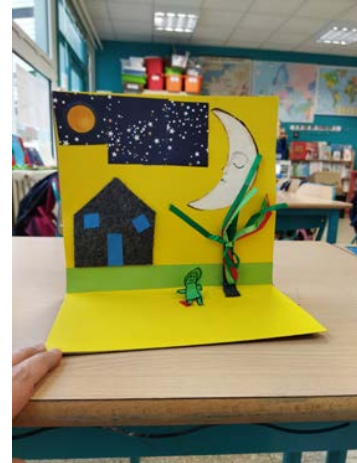
Exemples de réalisations © Marie Özveri