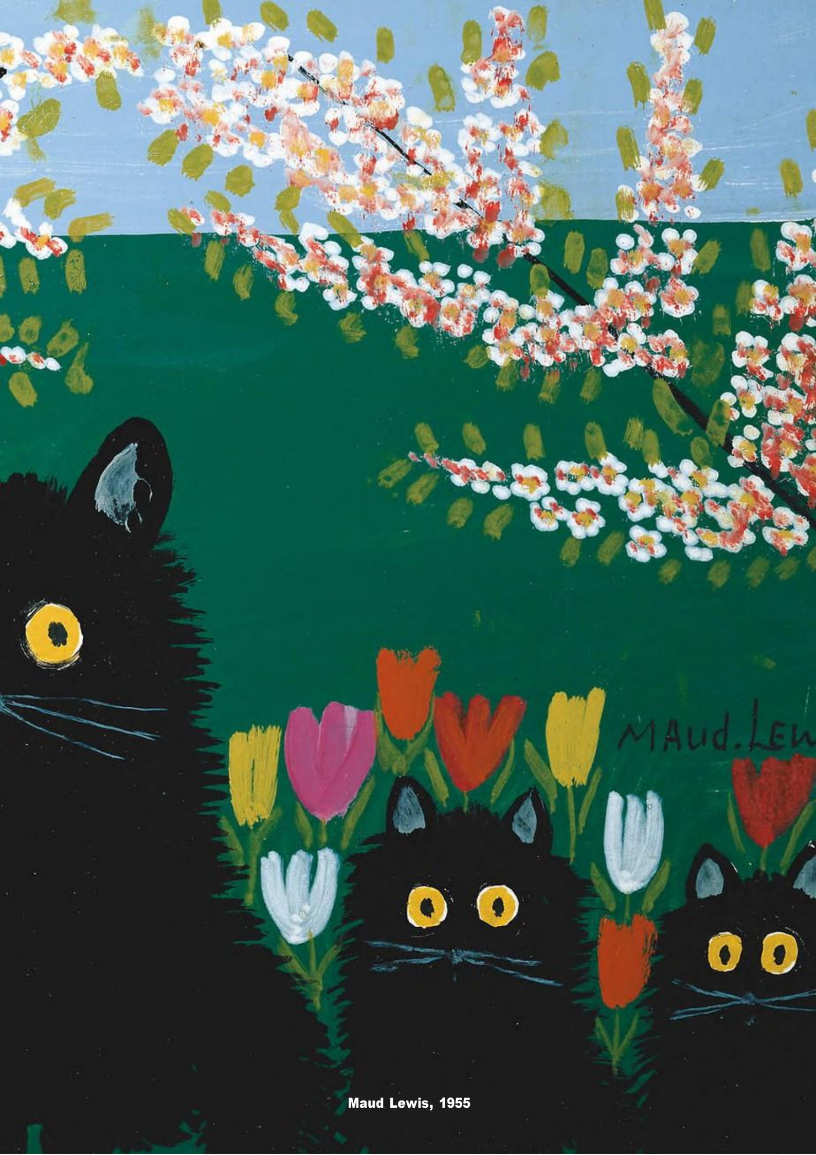
Maud Lewis, 1955