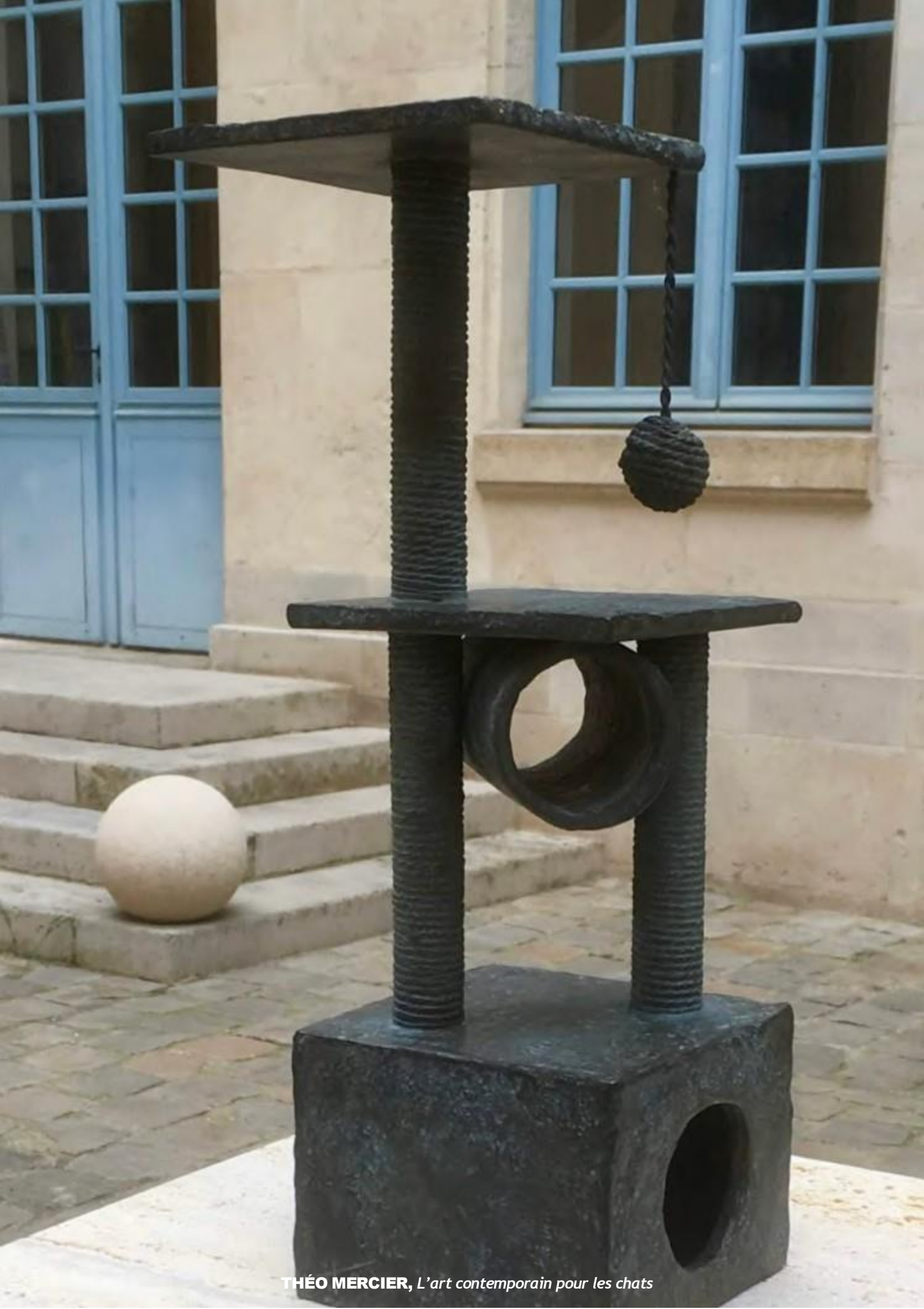
THÉO MERCIER, L'art contemporain pour les chats