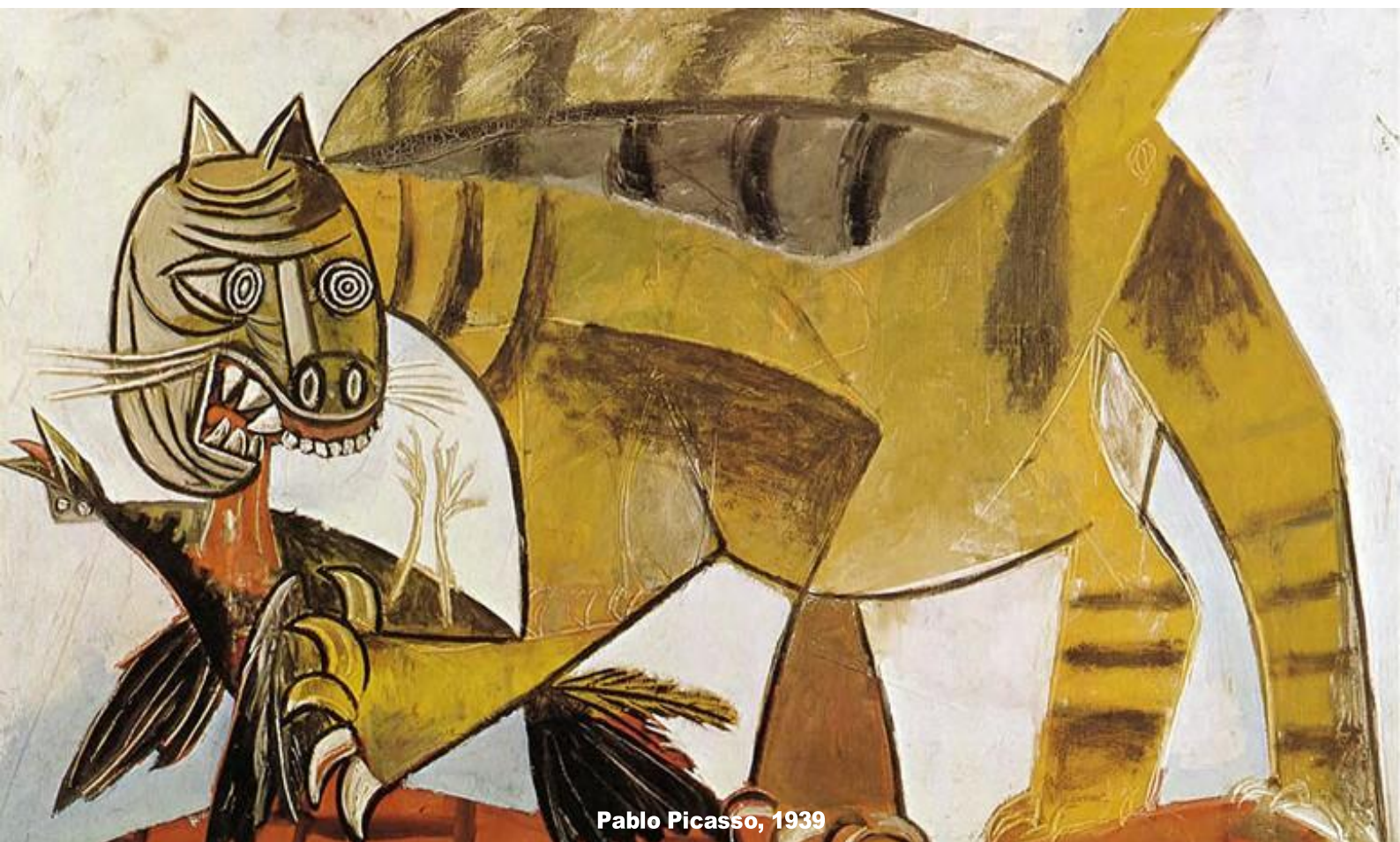
Pablo Picasso, 1939

En 2021, ils créent la pièce Showgirl adaptée du film Showgirls, de Paul Verhoven, au Théâtre Saint Gervais, Genève, dans le cadre du festival La Batie.