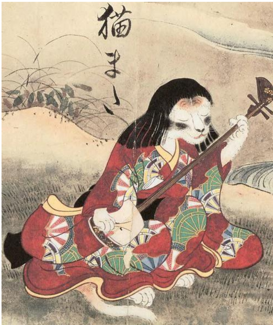
Anonyme, Japon, 1737

Fable animalière, ballet modern-jazz ou opérette kabuki, Les chats (Ou Ceux qui frappent et ceux qui sont frappés) réunit des interprètes de la comédie musicale Cats ayant décidé de fuir la société, tant l'avenir de la planète leur semblait compromis, et de remettre en cause leur condition humaine en se mettant à vivre comme des chats. Traversés par les souvenirs d'œuvres emblématiques du Broadway des années 1980, ces bestioles hybrides forment ainsi une communauté isolée, à l'abri de la catastrophe. Afin que même le plus petit chaton, dans cette froide obscurité sous les étoiles, puisse contribuer à un avenir meilleur, ils vont discuter, chanter, danser leurs préoccupations, leurs peurs, leurs doutes et leurs espoirs, emportés par le son du shô, l'orgue à bouche japonais. Deviendront-ils le reflet de ce qu'ils avaient fui? Finiront-ils par sortir? Y a t'il un ailleurs? Où est la vraie vie? Ce monde a-t-il encore un sens? Existe-t-il d'autres mondes? Sont-ils toujours vivants?