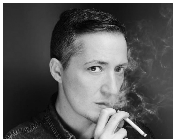
PAUL B. PRECIADO

Le travail d'Anne Pauly mêle plusieurs territoires d'écriture : l'intime, l'émotion, le cocasse, la collusion des univers fictionnels, mais aussi les univers de la contre-culture et du déclassement.