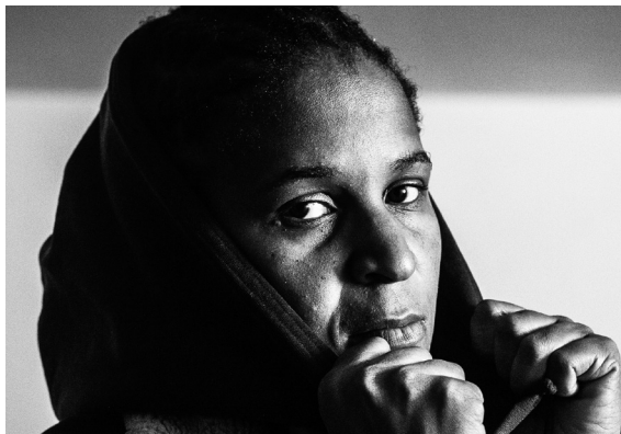
CASEY © TCHO ANTIDOTE