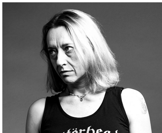
VIRGINIE DESPENTES

Son roman Delta Blues est paru en août 2021.