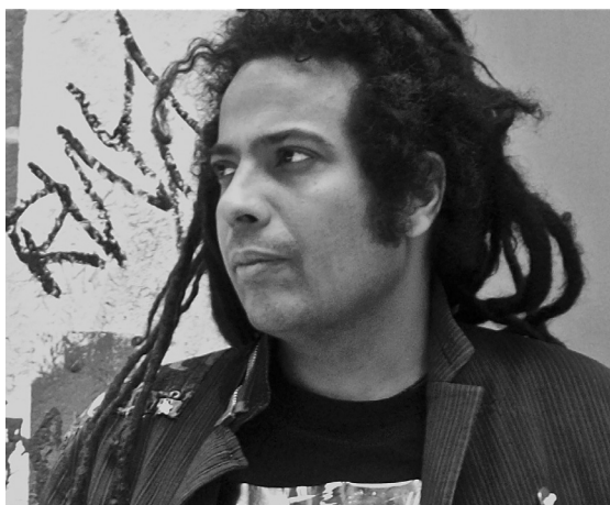
JULIEN DELMAIRE © GEORGIA ROBIN