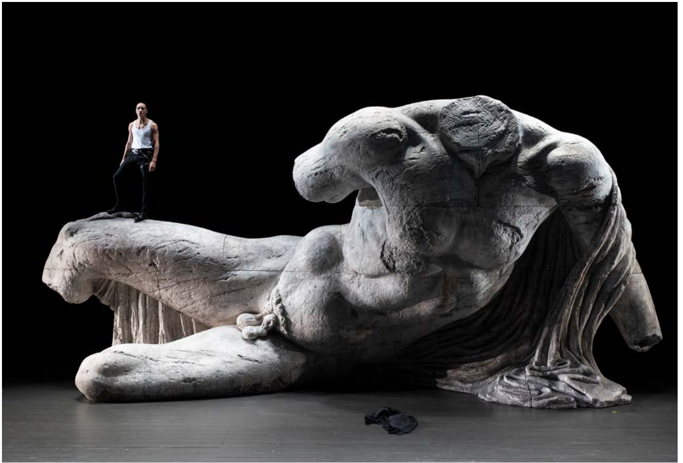
Dom Juan - vues 3D de la scénographie