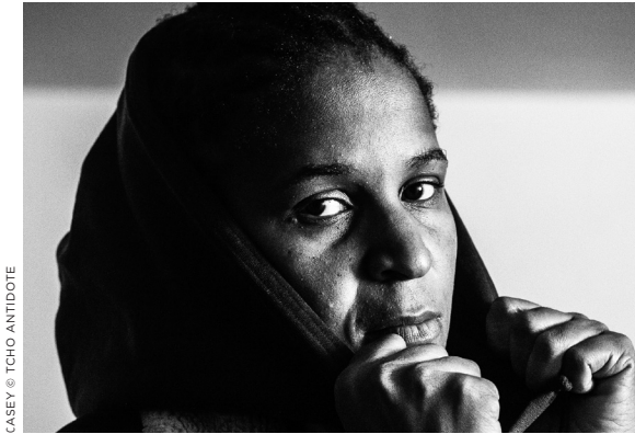
CASEY © TCHO ANTIDOTE